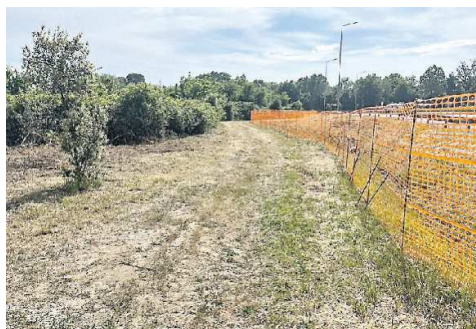
LAVORI IN CORSO Il cantiere per l'ultimo tratto di ciclabile

La ciclabile Portegrandi-Ca'Sabbioni fa un altro, decisivo passo in avanti. La Città Metropolitana ha, infatti, annunciato l'avvio dei lavori a Campalto per la realizzazione dell'ultimo tratto del percorso ciclabile che collegherà l'area di Ca' Sabbioni alla frazione di Portegrandi. L'intervento, previsto per essere completato entro la prossima estate, si sviluppa lungo la strada Orlanda, in prossimità dell'intersezione con via Sabbadino, vicino alla rotonda che permette di deviare verso il Villaggio Laguna o immettersi lungo il by pass di Campalto. Il nuovo tratto sfrutterà la ciclabile già esistente che conduce al Villaggio Laguna fino all'attraversamento di via Sabbadino, bypassando l'invaso di laminazione per poi tornare verso la statale, dove si collegherà con un corto segmento di pista ciclabile realizzato contestualmente. Entrambe le opere saranno completate nel giro di pochi mesi. Come spiega la Città Metropolitana, la scelta del tracciato e le caratteristiche tecniche sono frutto di un'attenta valutazione delle diverse ipotesi progettuali preliminari. «In particolare, si è deciso di minimizzare l'interferenza con la rotonda realizzata da Anas, con il marciapiede sul lato nord della Triestina e con gli attraversamenti pedonali esistenti». Con il completamento di questo ultimo tratto, cicloturisti e appassionati delle due ruote potranno